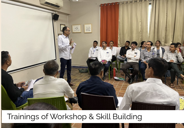
Trainings of Workshop & Skill Building