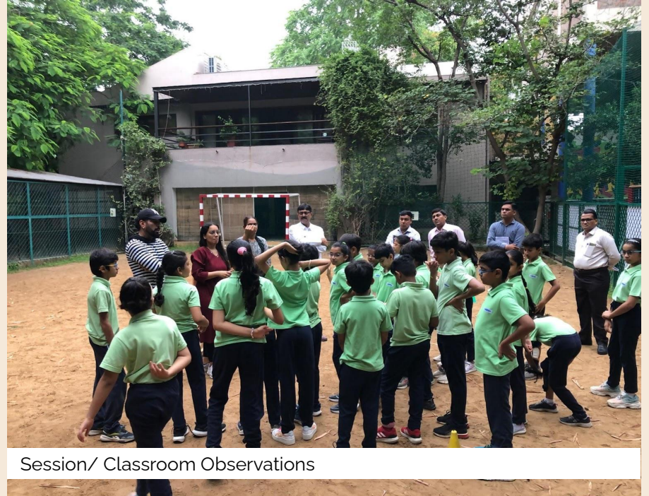
Session/ Classroom Observations