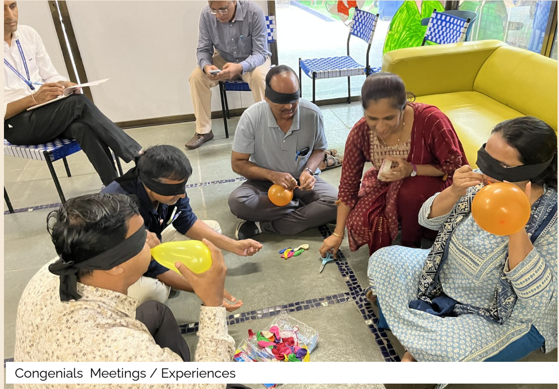
Congenials Meetings / Experiences