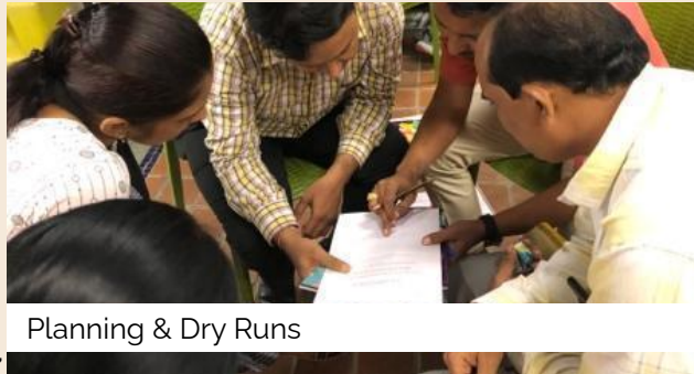
Planning & Dry Runs