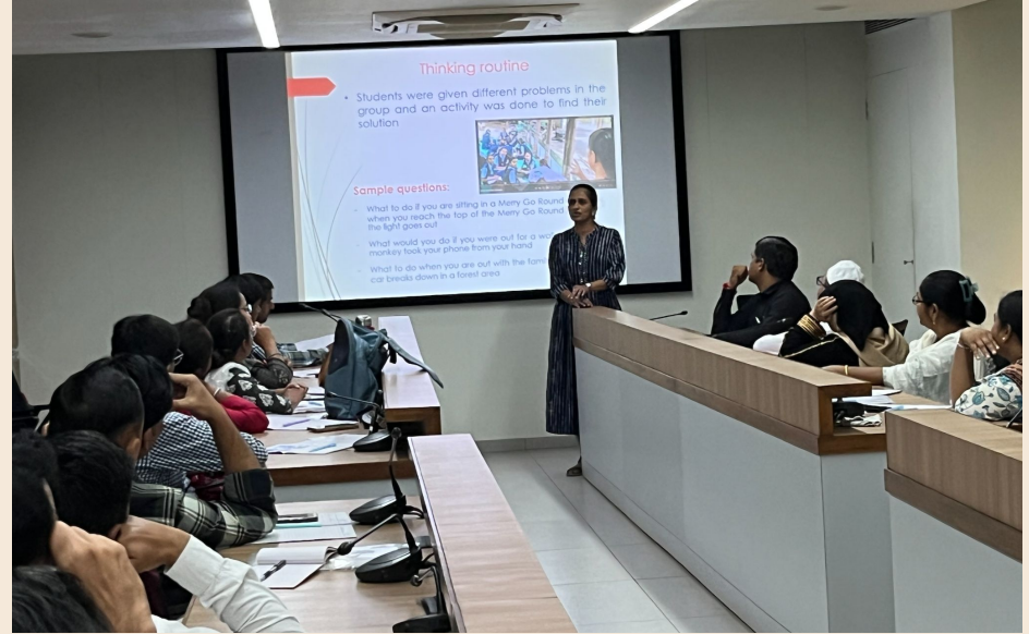
Sharing idea about Thinking Routines