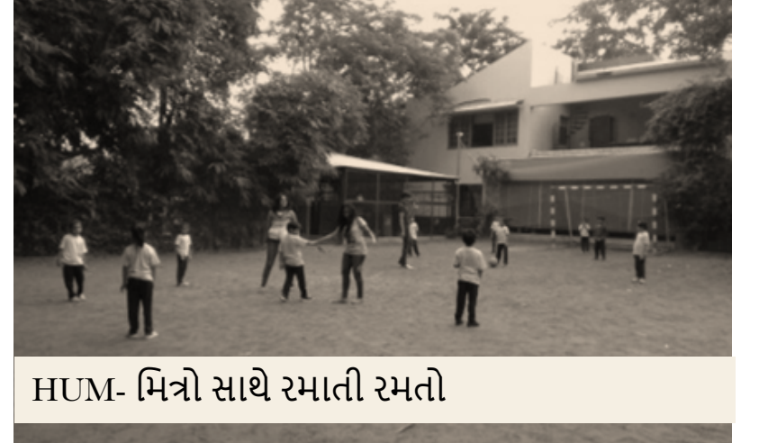
HUM- મિત્રો સાથે રમતી રમતો