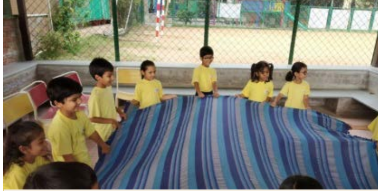
રમત-ગમતના નિયમોને સમજવું

સ્વ-નિયંત્રણ અને સમસ્યાનું નિરાકરણ અને સંઘર્ષ નિવારણ કુશળતા વિકસાવવા.