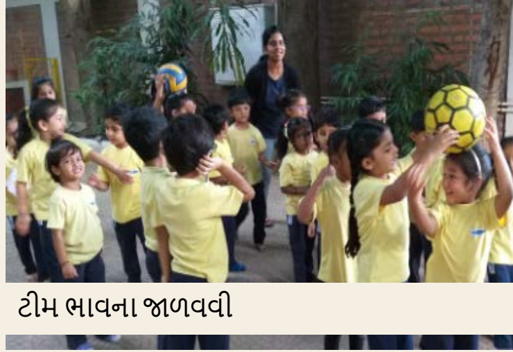
ટીમ ભાવના જાળવવી

સામાજિક કૌશલ્યોનો વિકાસ કરો જેમ કે સાંભળવું, "શેર કરવું", અને "મંતવ્યોનો આદર કરવો"