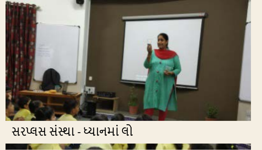
સરખ્લસ સંસ્થા - ધ્યાનમાં લો