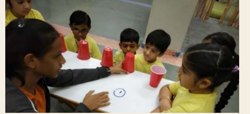
લોજિકલ મેથેમેટિકલ થિંકિંગ માટે HUM કોન્લોમ