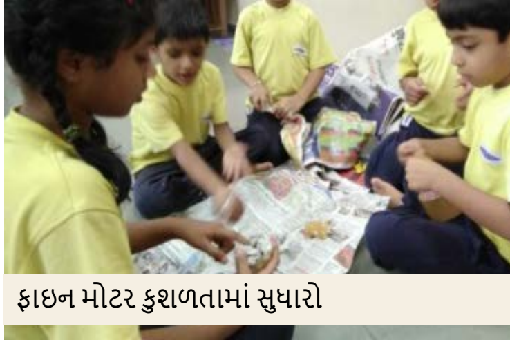
ફાઇન મોટર કુશળતામાં સુધારો