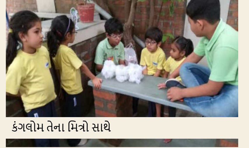
કંગલોમ તેના મિત્રો સાથે