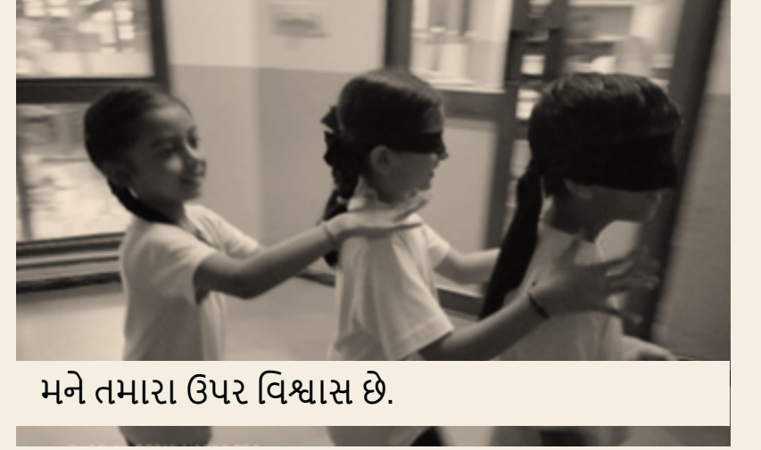
મને તમારા ઉપર વિશ્વાસ છે.