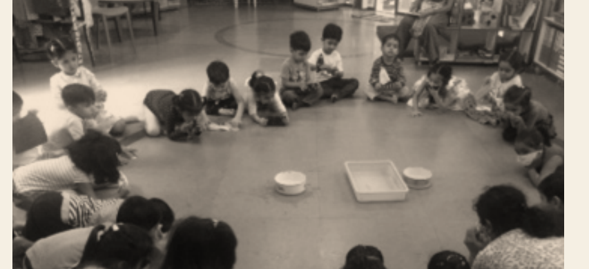
અવલોકન દ્વારા ગોકળગાય વિશે શીખવું