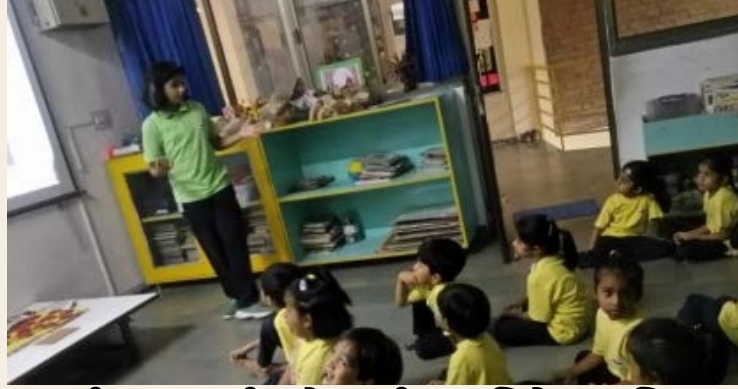
પ્રાણી કલ્યાણની સંવેદનશીલતા વિશે જાગૃતિ ઉભી કરવી

પર્યાવરણની જાગૃતિ અને આપણા વિશ્વમાં તેની ભૂમિકાને સમજવાની તક