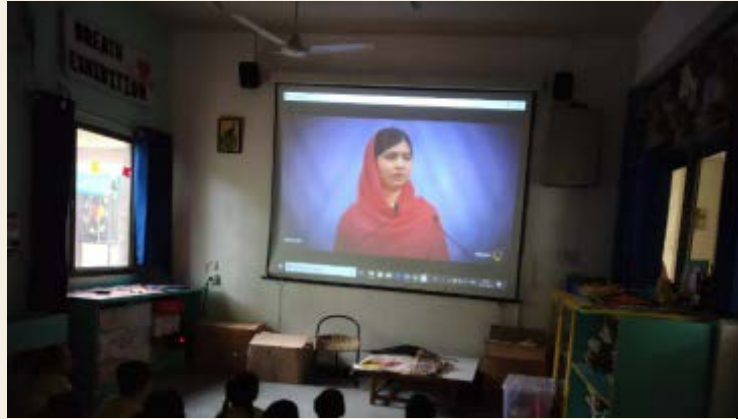
જાગૃતિ અને પ્રેરણા