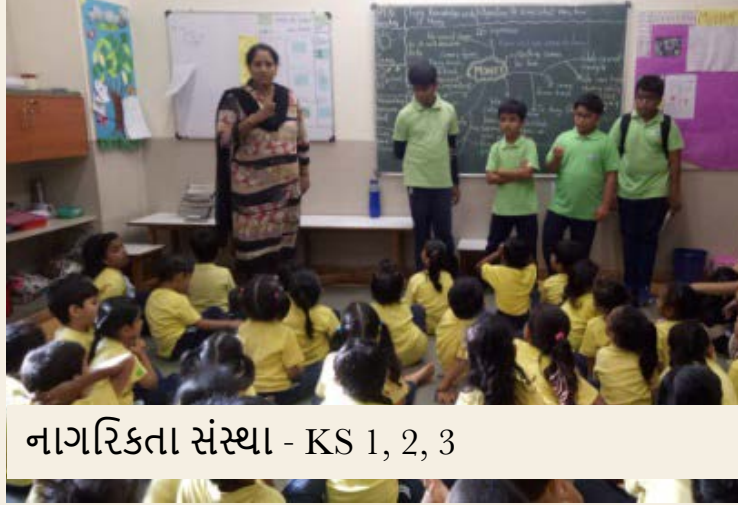
નાગરિકતા સંસ્થા - KS 1, 2, 3

પરિપ્રેક્ષ્ય વિકસાવવાની તક, જે કૃતજ્ઞતાની લાગણી વિકસાવે છે અને હેતુના બીજ વાવે છે.