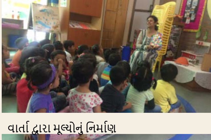
વાર્તા દ્વારા મૂલ્યોનું નિર્માણ